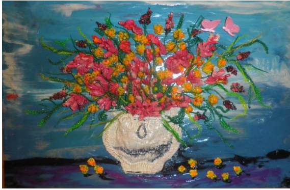
«Ваза с цветами»