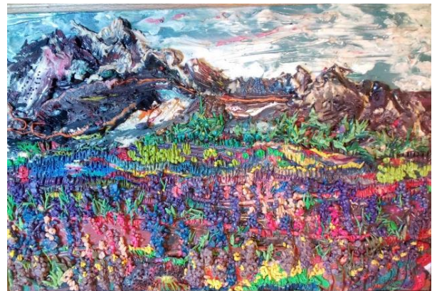
«В гости к солнышку»