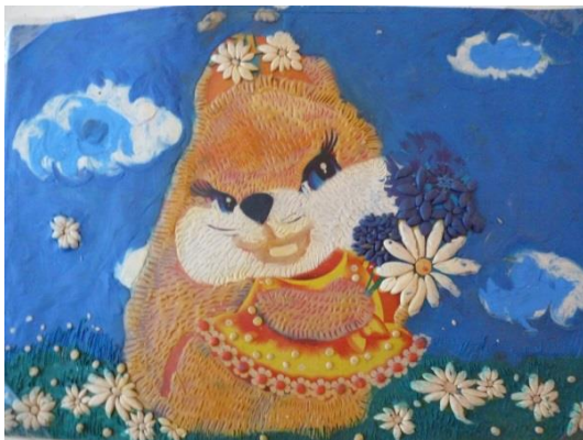
«Орешки для белочки»