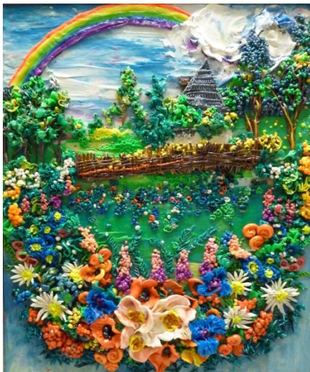
«Цветы на поляне»