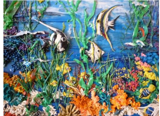
«Рыбки в аквариуме»