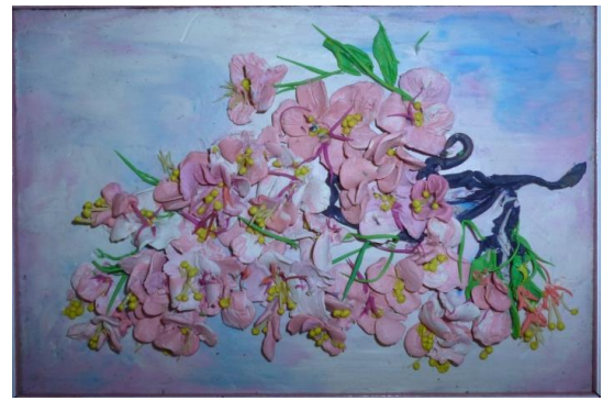
«Букет из весенних цветов»