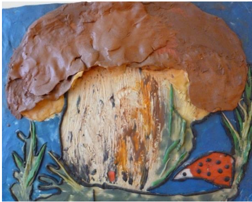
«Гриби-грибочки выросли в лесочке»